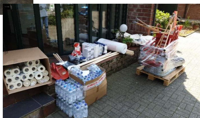
Bilder vor der Verladung